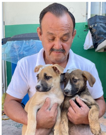
Dos cachorros en la campaña de abril

Otros 10 fueron esterilizados durante dos sesiones de capacitación para nuestros estudiantes veterinarios, realizadas en la clínica del Dr. Ricardo Montes de Oca.