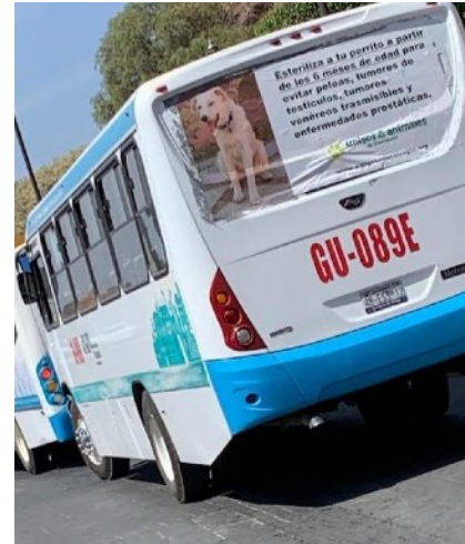
Esteriliza a tu perrito a los seis meses de edad

Estos mensajes permanecerán en los autobuses hasta el medio de junio. Son vistos por miles de personas cada día.