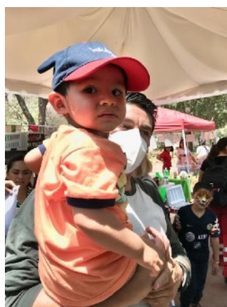
Muchos niños asistieron con sus padres