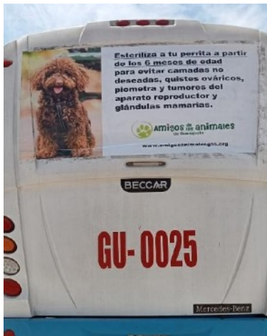
Esteriliza a tu perrita a los seis meses de edad

Nuestros dos mensajes en camiones urbanos durante enero por marzo enfocaron en las ventajas saludables de esterilización a gatas hembras y gatos machos. A principios de abril, empezamos a mostrar dos nuevos mensajes sobre las ventajas de esterilización a perros—hembras y machos.