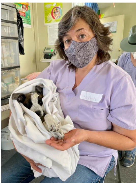
Este perrito está listo para ir a casa

Y el 22 de mayo realizamos otra campaña en Cerro del Cuarto, durante la cual esterilizamos a 78 perros y gatos. En esta campaña esterilizamos a tanto perros machos como hembras (24 cada uno) y a 22 gatas. En total, en lo que va del año, hemos esterilizado a 531 animales.