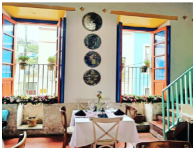
El premio de una comida o cena en El Mestizo Restaurant recibió la friolera de 22 ofertas

¡Y qué premios había! Ciento cuarenta y cinco de ellos, que incluyen maravillosas experiencias gastronómicas en restaurantes y hogares locales, hospitalidad en varios B&B y hoteles atractivos, numerosos tratamientos de belleza y salud, recorridos interesantes, algunas obras de arte y artesanías, impresionantes, joyas, lecciones y servicios de muchos tipos, y oportunidades para visitar lugares en otros lugares de México y el extranjero, todo a precios atractivos. Cincuenta y ocho afortunados fueron los ganadores.