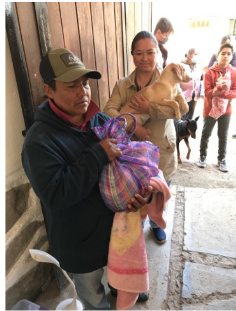
Esperando su turno

Sin desanimarse, el equipo se puso a trabajar y se quedó hasta las 7 p.m., esterilizando todos los casos registrados. Nuestras felicitaciones a los miembros de equipo y nuestro agradecimiento a los dueños de las mascotas por su paciencia.