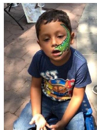
La pintura facial era muy popular