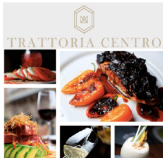
Un premio popular fue una comida o cena en el restaurante Trattoria Centro