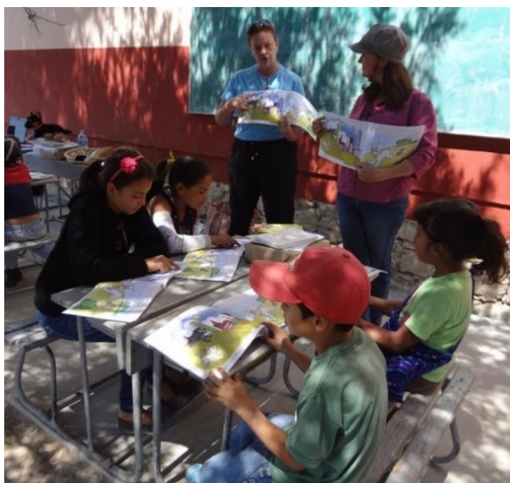
Leyendo un cuento a niños

Si tienes experiencia en la enseñanza, nos puedes ayudar con un programa de educación comunitaria para niños. La fluidez en español es deseable, pero no necesaria. Para obtener más información, contáctanos en amigos@amigosanimalesgto.org .