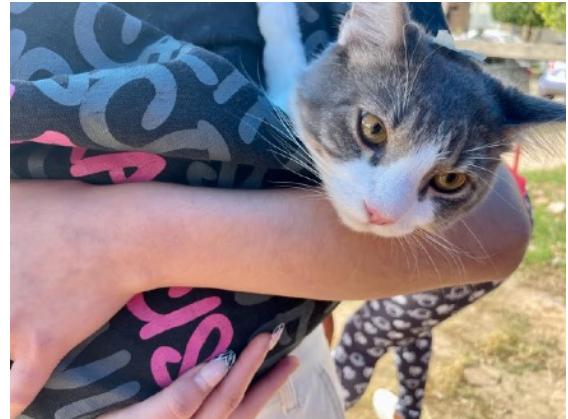
Uno de los 15 gatos en Valle de San José ese día