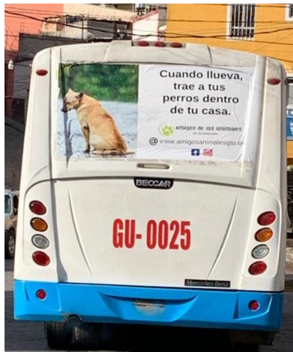
“Cuando llueva, trae a tus perros dentro de tu casa.”