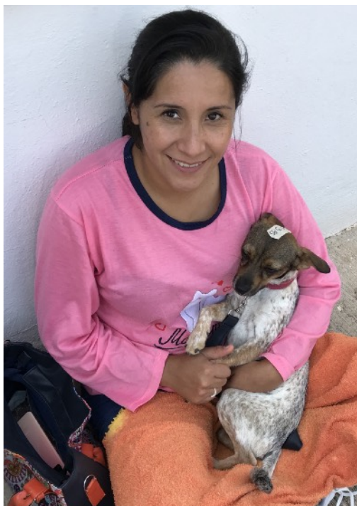
Esperando su turno, Villas de Guanajuato