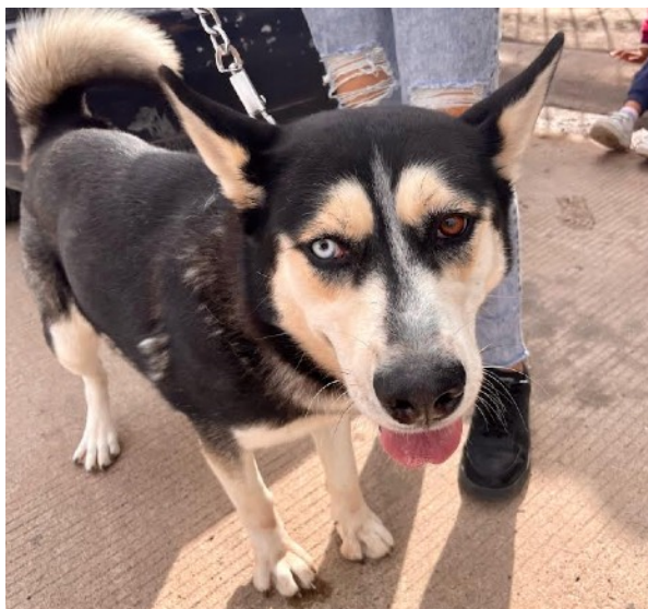
Trece perros eran machos