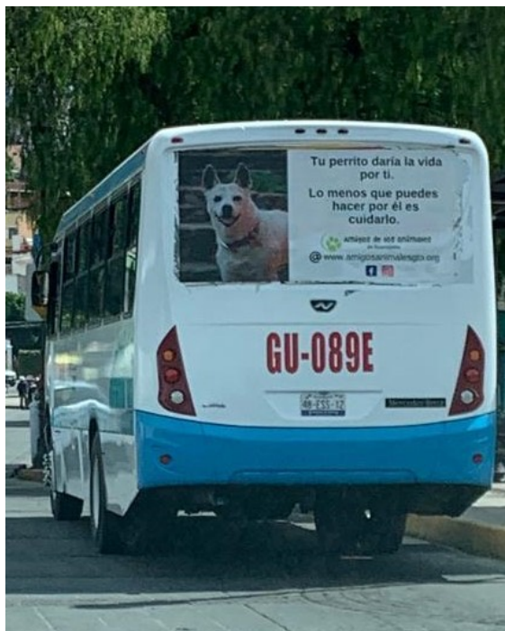
“Tu perrito daría la vida por ti. Lo menos que puedes hacer por él es cuidarlo.”

En julio aparecieron dos nuevos mensajes en dos autobuses urbanos. Como el verano es la temporada de lluvias en Guanajuato, un mensaje insta a las personas a resguardar a sus perros cuando llueve. El otro reitera que los perros son extremadamente leales y merecen un buen trato. Los mensajes, que permanecerán en los autobuses hasta octubre, son vistos por miles de personas cada día.