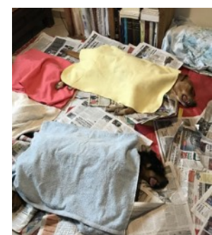
Perros en el área de recuperación