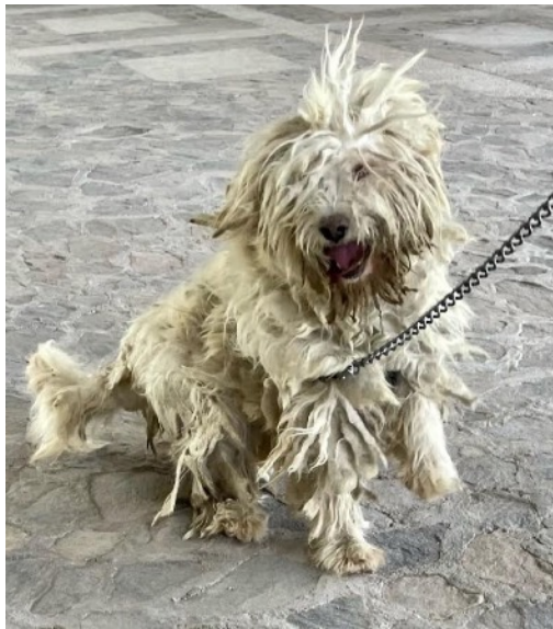
Un perro que necesitaba atención

La campaña de Campuzano fue una decepción por la baja participación. Pero nuestro equipo descubrió un perro muy descuidado (esterilizado en una campaña anterior allí) y le cortó el pelaje con el permiso de su dueña.