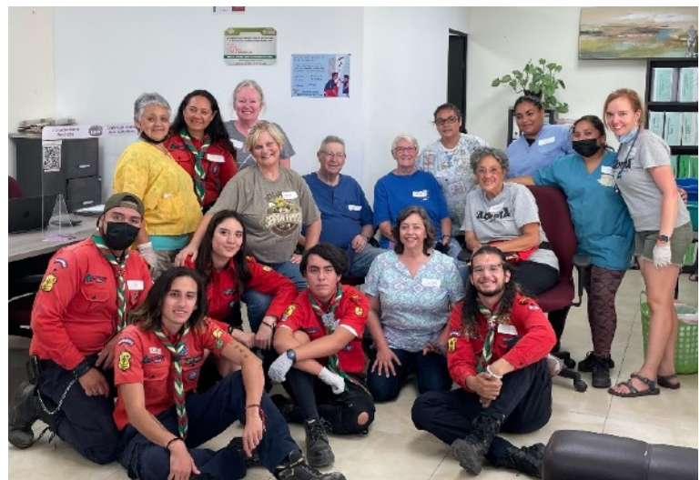
Voluntarios posaron para una foto de grupo después de la campaña