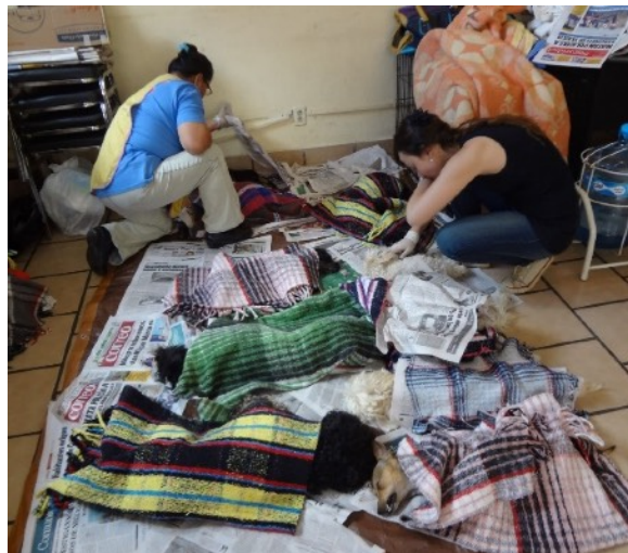
Voluntarias revisando animales en la unidad de recuperación