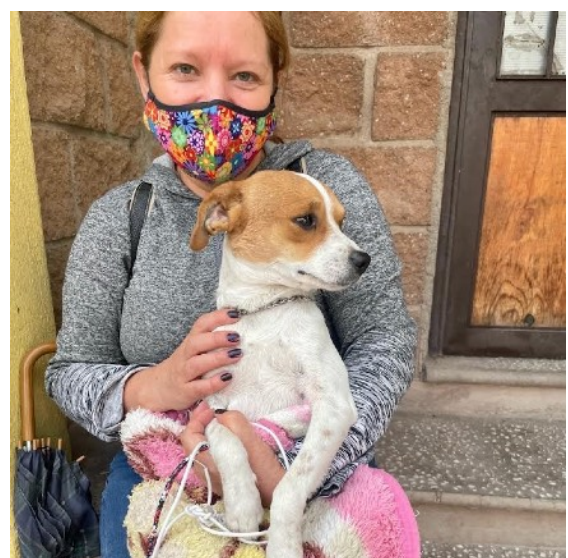
Uno de los 36 perros con su dueña