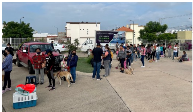
Esperando para registrarse, Villas de Guanajuato