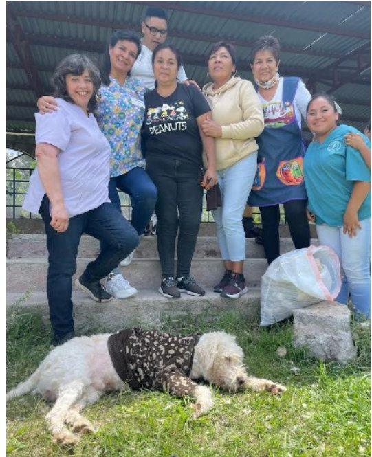
¡Bien hecho, equipo!