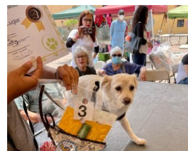
Tercer premio, Sky