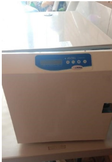
Nuestra autoclave, usado para esterilizar instrumentos quirúrgicos y paños

Aunque un refugio responde directa y humanamente al trágico problema de la sobrepoblación de mascotas creado por la negligencia de las personas, su acción no traduce en un cambio favorable en el comportamiento irresponsable. Las personas irresponsables seguirán abandonando a sus mascotas, esperando que otras las rescaten y las cuiden. Por lo tanto, cuando comenzamos Amigos hace 20 años, decidimos enfocarnos en prevenir el problema de las crías no deseadas ofreciendo servicios de esterilización y educando a los dueños de mascotas sobre sus responsabilidades hacia estas mascotas.