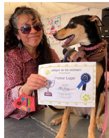
Primer premio, Missy

Naturalmente, la ganadora en la categoría más ruidosa, la perra que ladró más ferozmente, fue una de las más pequeñas. ¡Y ella fue uno de los afortunados perros adoptados durante el evento!